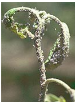
Obr. 3: Napadnutý letorast