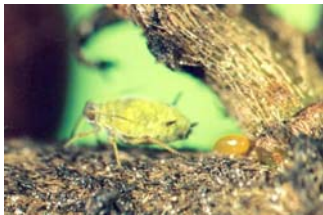
Obr. 2: Aphis pomi prezimujúce vajíčko na konári stromu (Jaškiewicz, 2005)